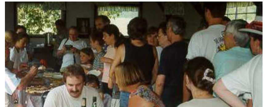
Les desserts sont servis : à l'attaque!